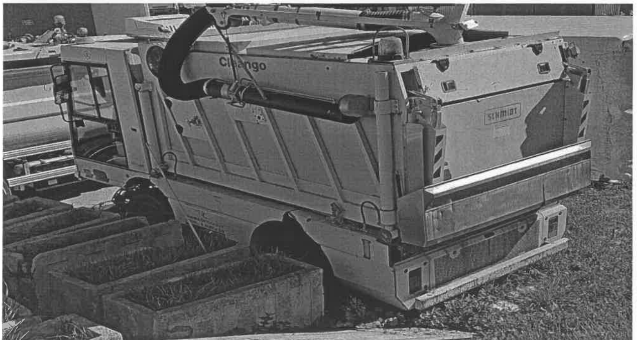
2 SCHMIDT, S4W1C, CLEANGO ZA9S4W1CSEME89493

Procjena radnog stroja SCHMIDT, S4W1C, CLEANGO ZA9S4W1CSEME89493