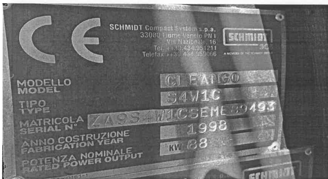
4 Pločica stroja

Procjena radnog stroja SCHMIDT, S4W1C, CLEANGO ZA9S4W1CSEME89493 Darko Trcin dipl.ing.