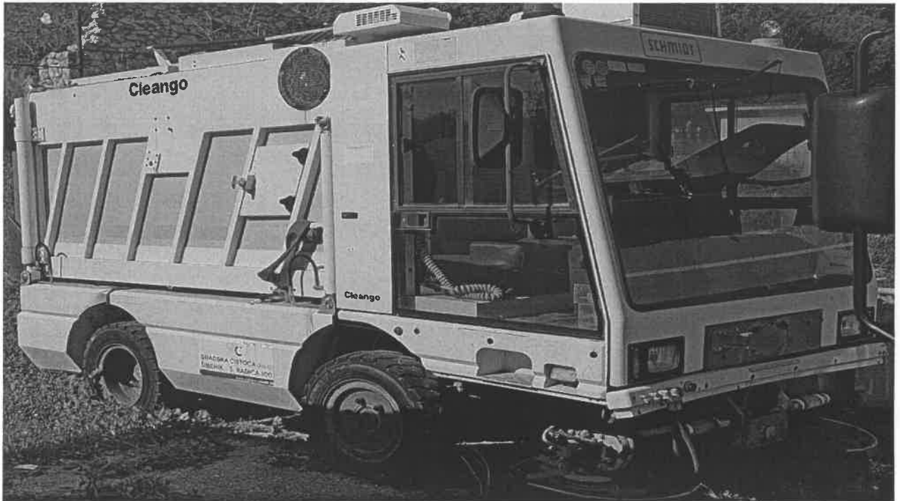
1 SCHMIDT, S4W1C, CLEANGO ZA9S4W1CSEME89493 prednji dio